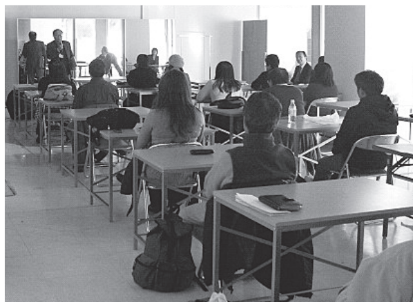
NPOさいたまネット・NPO地域コーディネーター養成科講義風景